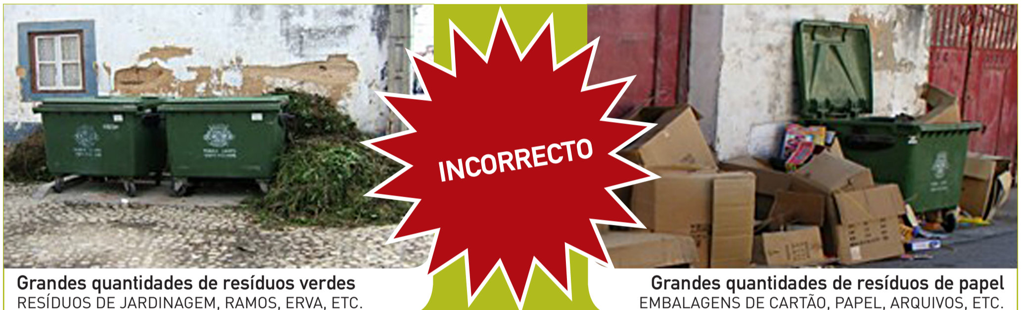
Grandes quantidades de resíduos verdes RESÍDUOS DE JARDINAGEM, RAMOS, ERVA, ETC.

O DEPÓSITO DE GRANDES QUANTIDADES DE RESÍDUOS NA VIA PÚBLICA, JUNTO AOS CONTENTORES DO LIXO, É ILEGAL E DEGRADA A QUALIDADE DO AMBIENTE QUE TODOS QUEREMOS MANTER NO NOSSO CONCELHO.