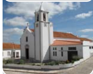
Igreja Nossa Senhora do Ó