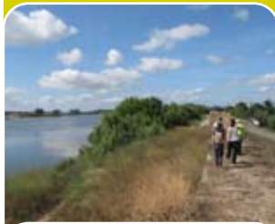
Ponte D. Amélia